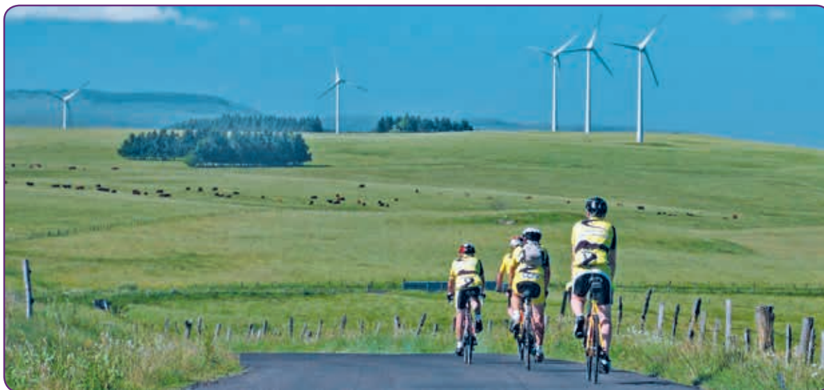
Le CCPV sur les hauteurs du Cézallier en juin 2017