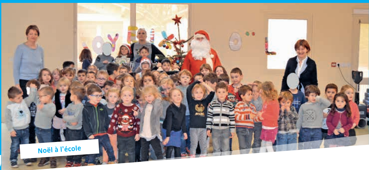
Noël à l'école