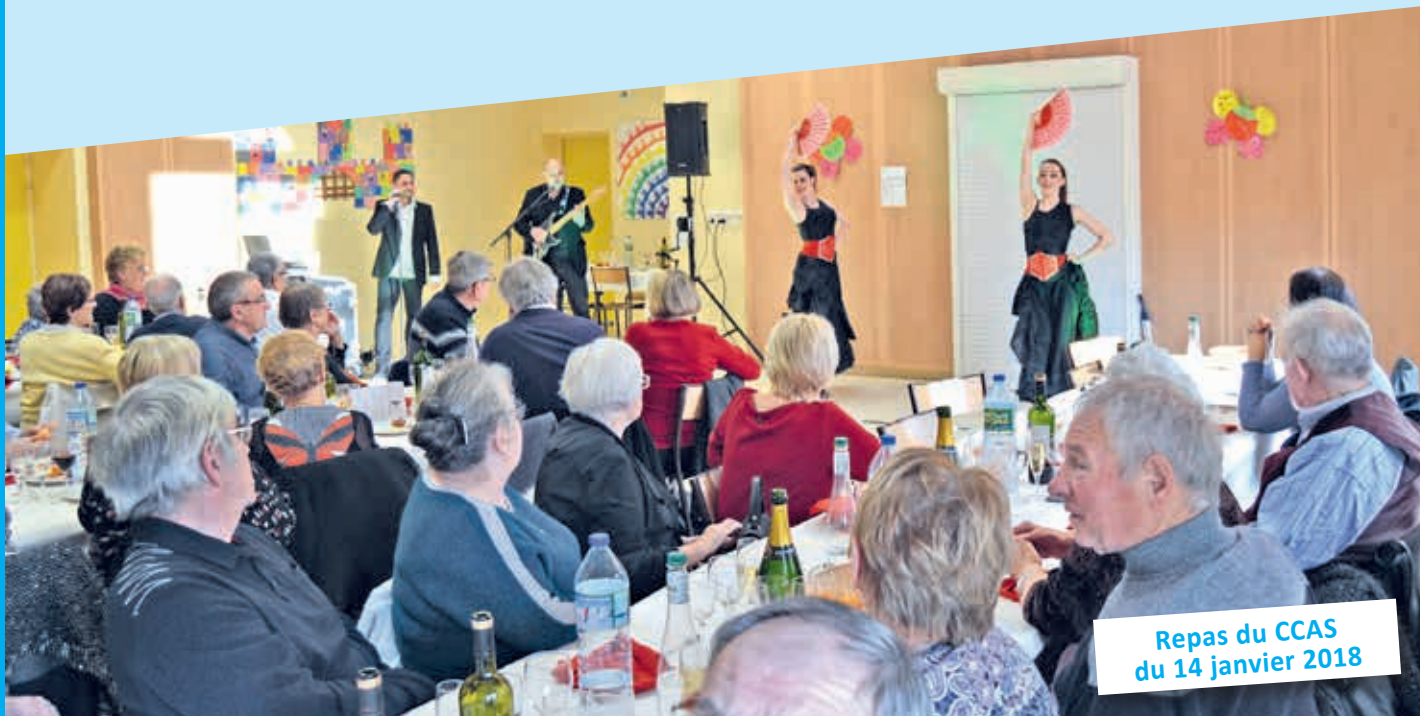
Repas du CCAS du 14 janvier 2018